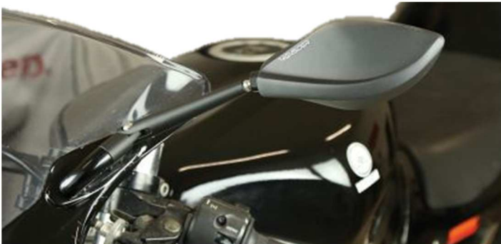
Montage Beispiel 1 (Adapter 304-020)

Find useful additional accessories like housings, indicators, taillights, resistors, electronic relay, adapter cable and other equipment in our webshop!