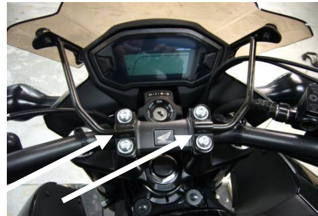
Foto 2 Schrauben die entfernt und ersetzt werden