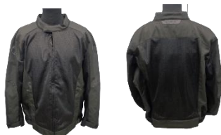
BERING NELSON King Size BTB1520 noir black