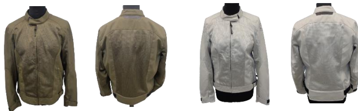
BERING NELSON BTB1429 Kaki khaki

BTB1420 noir black ; BTB1428 gris clair light grey ; LADY BTB1430 noir black LADY BTB1439 kaki khaki