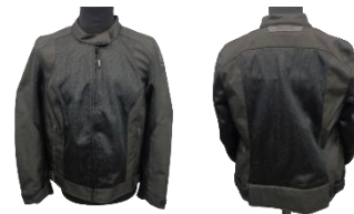
BERING LADY NELSON Queen Size BTB1560 noir black